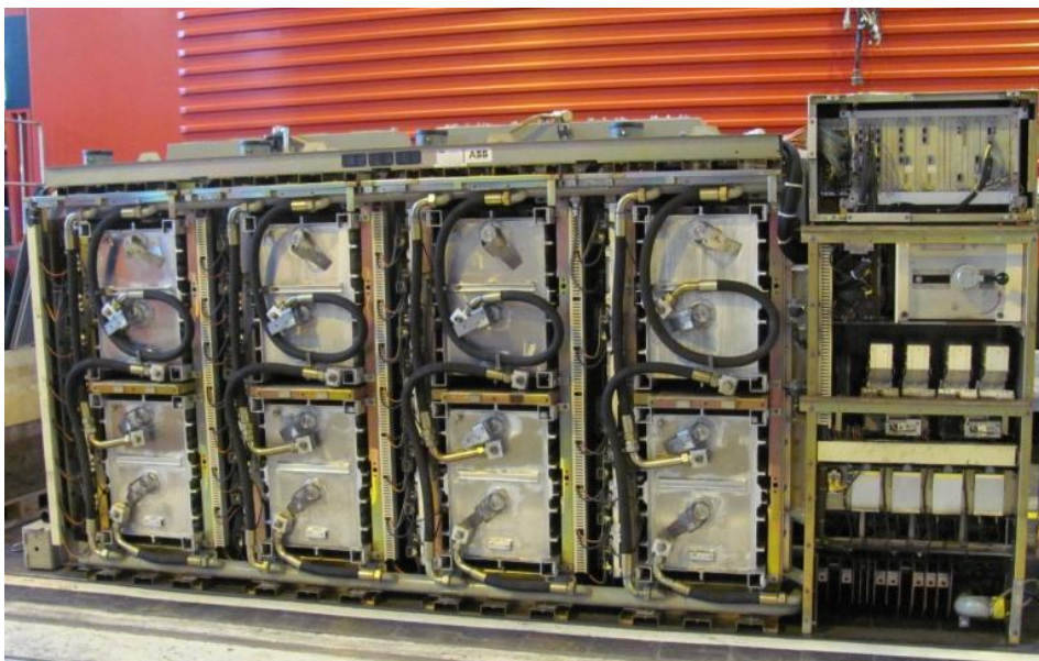
Heutiger Umrichter der Re460 mit alten GTO-Technologie.